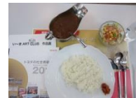
チキンカレーセット