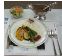
野菜カレー サラダ

会員総数 21名 出席者 12名 出席率57. 14% 前々回補正出席率 95. 24%